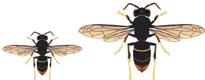
Fondatrice (20 à 32 mm)